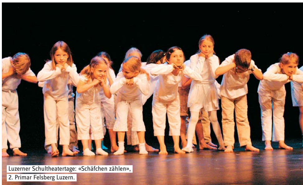
Luzerner Schultheatertage: «Schäfchen zählen», 2. Primar Felsberg Luzern.

Unsere Fachbibliothek umfasst Schultheaterstücke sowie eine Auswahl theaterpädagogischer Fachliteratur. Sie steht interessierten Besucherinnen und Besuchern zur Verfügung. Ausleihen für eine Woche sind möglich.