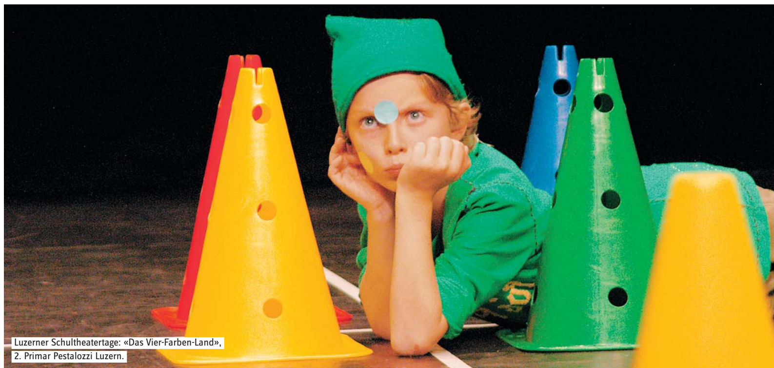
Luzerner Schultheatertage: «Das Vier-Farben-Land», 2. Primar Pestalozzi Luzern.

Seit 2004 gehört das Zentrum Theaterpädagogik zur Pädagogischen Hochschule Luzern und ist dem Leistungsbereich Dienstleistungen angegliedert. Lehrpersonen, Projektleitende, Spielleitende und Studierende können diese Drehscheibe für Informationen, Angebote und Dienstleistungen rund um die Theaterpädagogik nutzen und profitieren vom umfassenden Know-how des Zentrums.