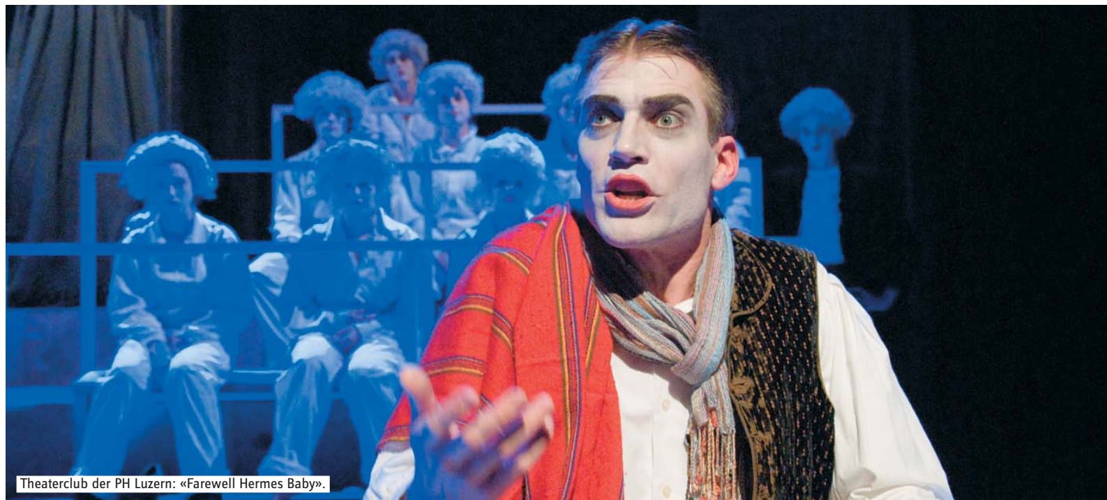
Theaterclub der PH Luzern: «Farewell Hermes Baby».

Die erworbenen ECTS-Credits können für ein weiterführendes Studium bei Till-Theaterpädagogik ( www.till.ch ) angerechnet werden.