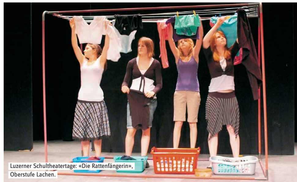
Luzerner Schultheatertage: «Die Rattenfängerin», Oberstufe Lachen.