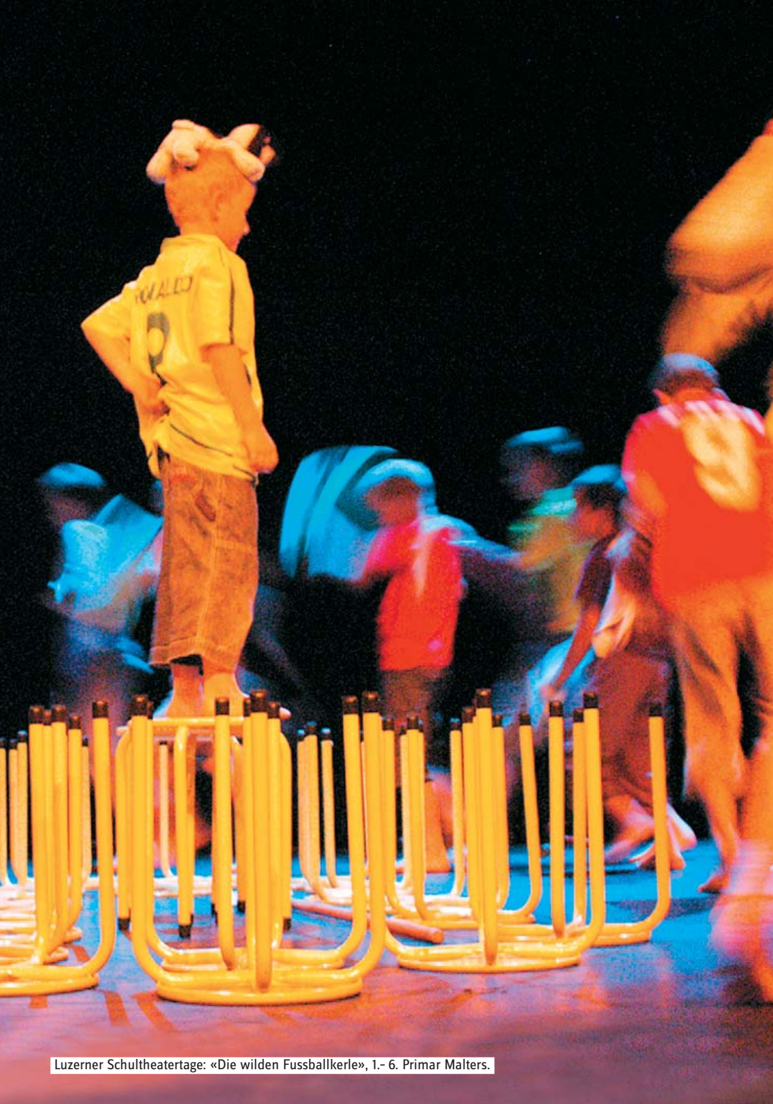
Luzerner Schultheatertage: «Die wilden Fussballkerle», 1.- 6. Primar Malters.